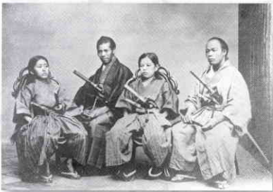
高峰譲吉 (長崎留学時)